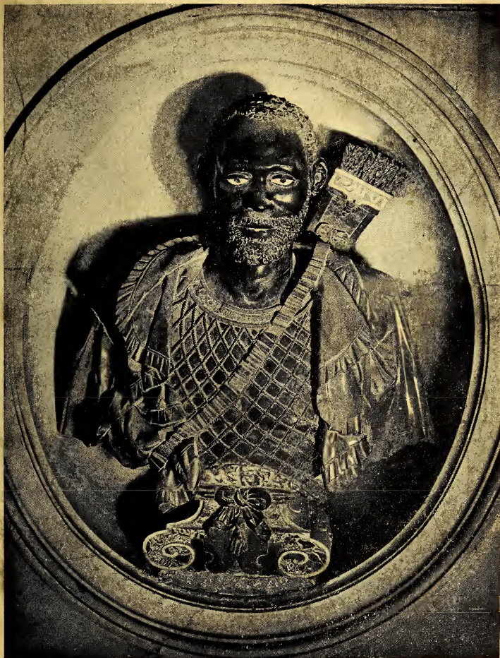
ANTOINE EMMANUEL DE FUNTA AMBASSADEUR DU CONGO AUPRÈS DU PAPE PAUL V BORGHESE